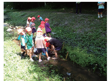
↑元気に自然を満喫することも達