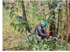
太めの木もノコギリで伐採

12名での活動となりました。センター裏の林内整備を行いました。伐る木、残す木を考えての作業、大変ありがとうございました。