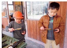
使った道具はキレイに片づけ