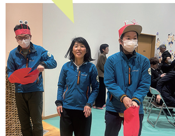
↑カニーズでお見送り