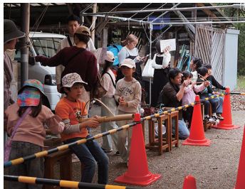
↑射的会場は大賑わいでした