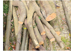
伐採後、工作や薪に利用