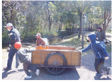
作業道具を積んで出発！

22名での活動となりました。木道沿いのササ刈り、モチツツジの枯葉取り、柴作りの3チームに分かれて活動を行いました。