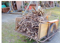
リヤカーいっぱい柴完成