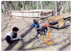
短く切った枝で柴作り