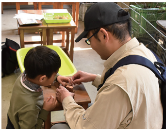
↑親子で一緒にチャレンジ！

その中から3月28日(土)に開催した「森からの挑戦状20」の様子をお届けします。