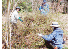
モチツツジの枯葉取り