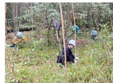
林床に生えたササを手刈り