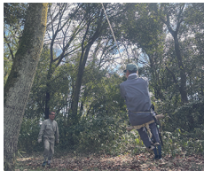
フィールド準備中

16名での活動となりました。活動内容は、イベントで使用する場所の危険箇所・危険木のチェックなどのフィールド準備と、ケヤキの林付近の竹伐採をしました。