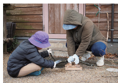
柴作り① 細かく切ります

初めての方3名を含む19名での活動となりました。活動内容は、雨天だったこともあり、テントの下で柴作りをしました。柴をくくるときにはローワークを駆使してギュッギュッと縛ることができました。先月までモリイコ！に参加してくれていた子ども、お母さんと一緒に参加してくださいました。