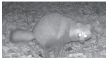
トイレ中のタヌキさん