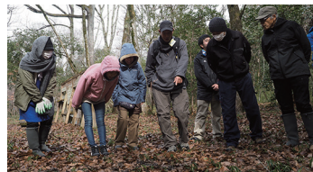
大量のフンを発見！

フィールドサイン「ノウサギ編」をしました。ノウサギとアナウサギ（カイウサギ）の違い、前歯が6本ある！などのウサギのあれこれの話と、ウサギのフィールドサイン（草の食べ痕やフン）が見つかった野鳥観察壁付近にトレイルカメラを設置した調査結果を報告。カメラに写っていたのはタヌキでした。話の後は、実際に森に行ってフィールドサイン探し。なんと大量のフンを発見！「タヌキの”ためフン”かな？」「センダンの種がたくさん入ってるけど、毒じゃなかった？」「これは違う種が入ってるよ」などと色々な推理をしました。他にも様々なフィールドサインが見つかり、いきものの生活を想像しながら森を歩く観察会となりました。観察会の後、ためフンの場所にトレイルカメラを設置しました。カメラに映ったのは、トイレ中のタヌキさんでした。