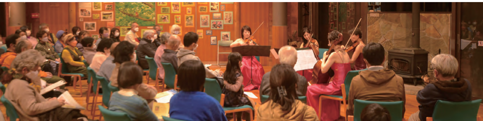
2022年のコンサートの様子です