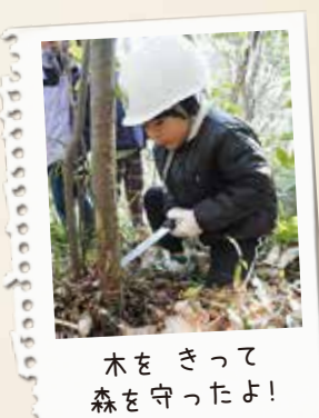
木をきって森を守ったよ!