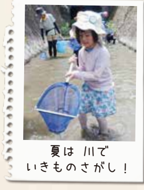
夏は 川でいきものさがし!