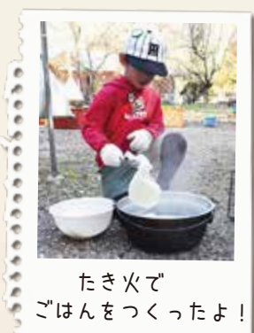
たき火でごはんをつくったよ!