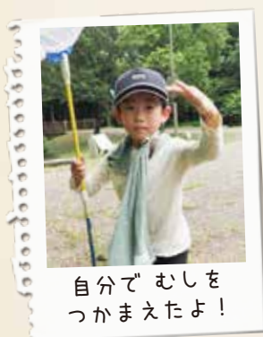
自分で むしをつかまえたよ!