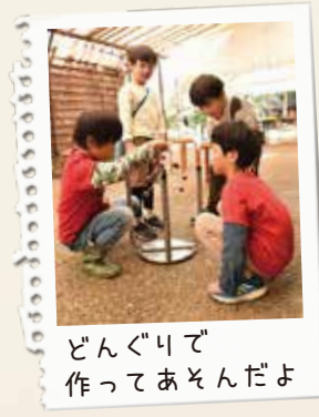
どんぐりで作ってあそんだよ