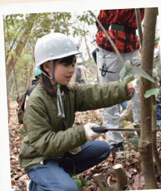
木をきって森を守ったよ!