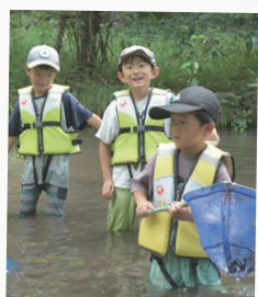
夏は 川でいきものさがし!