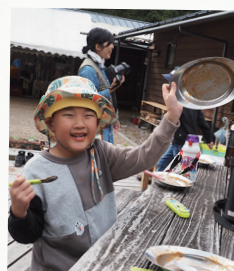
たき火でごはんをつくったよ!