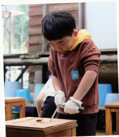
小刀を使って工作したよ~