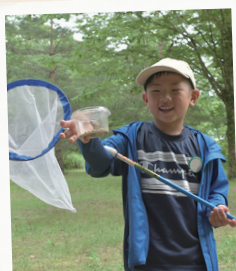
自分で むしをつかまえたよ!