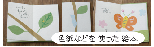
色紙などを使った 絵本

完成!! (こんな絵本ができる予定!) 見開きでこのチラシサイズの 絵本を作ります。